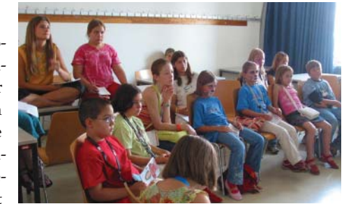
... richtigen Umgang mit Behinderten.

Antwort: Das Kind ist blind und hat mit Hilfe seiner Hände die so genannte Brailleschrift gelesen. Du siehst also: Auch „behinderte“ Kinder sind in einigen Dingen besser als du!